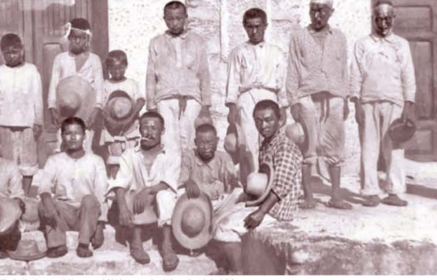
Trabajadores chinos en México a principios de siglo XX.

Más allá de lo anterior, es importante reconocer que el actual gobierno y la 4T ha realizado cambios cualitativos con respecto a China. Hace apenas unos días la Secretaría de Gobernación invitó a un reconocimiento por parte del Gobierno de México –y concretamente por parte de la Secretaría de Gobernación– a un “acto de petición de perdón a miembros de la comunidad china” y puntualmente durante las décadas de 1930-1960. El evento, adelantándose a un evento posterior con el propio presidente de México en 2021, fue extremadamente emotivo: las palabras de la secretaria de Gobernación que reconoció errores y lamentó los agravios del Estado mexicano en su momento, fueron escuchadas por un grupo de mexicanos-chinos de la comunidad china en México que vivieron atroces racismo, persecuciones y hasta la expulsión de México durante estos períodos.