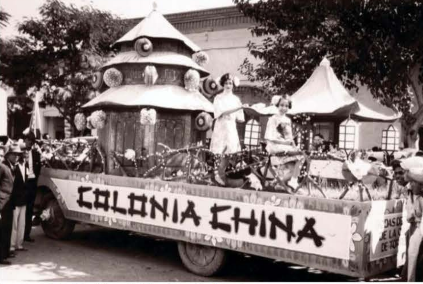
Carro en colonia china.