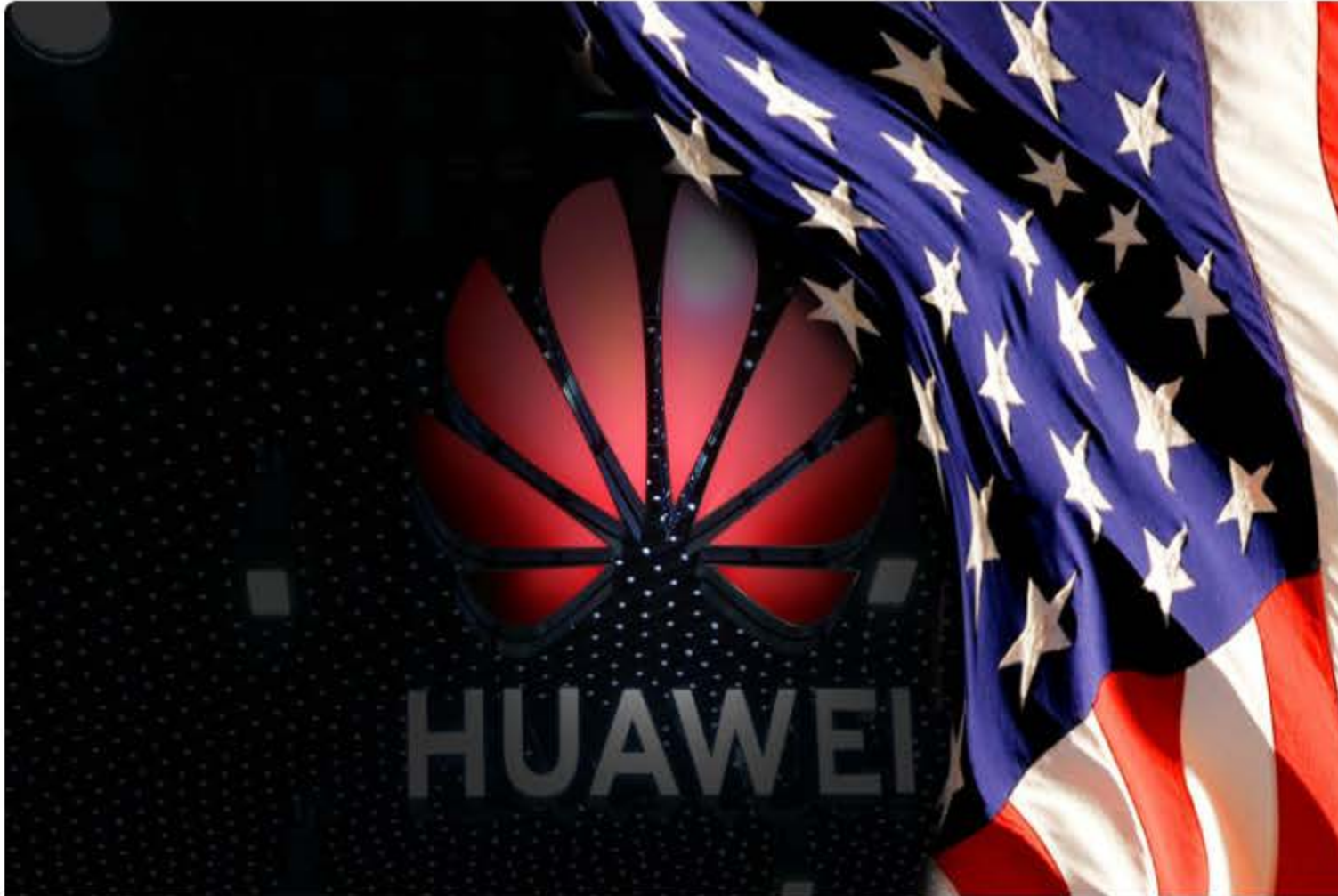
Imagen: https://esellercafe.com .